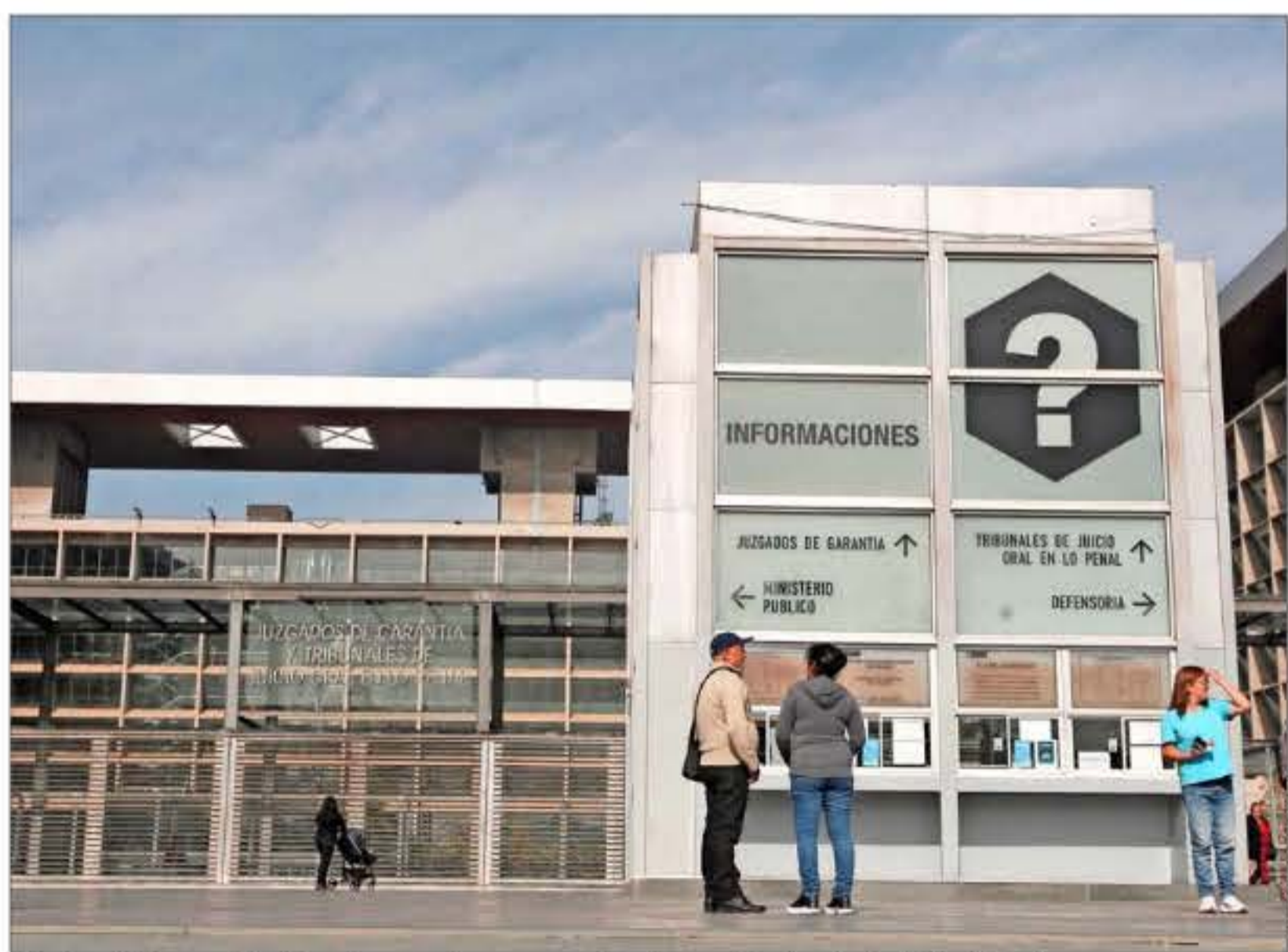
Muchas de las audiencias clave en este mes se realizarán en el Centro de Justicia de Santiago.